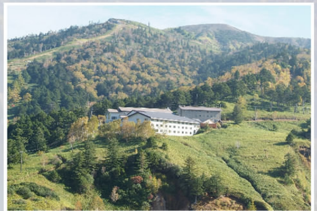
万座温泉 ホテル聚楽

*参加者には写生会プログラムをおくります。 申込：下記事項を記入し、日美事務所までファックスまたは 郵送してください。 参加者は郵便振り込みで早めに参加費納入をお願いします。 郵便振替 00160-7-85881 日本美術会